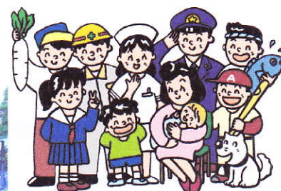
みんな仲間、みんな幸せ