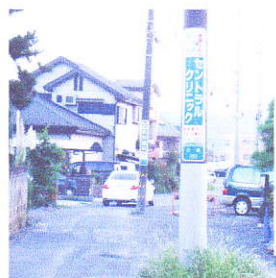
区画整理：笠縫地区